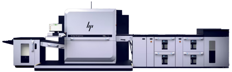
HP Indigo 18K digitale pers